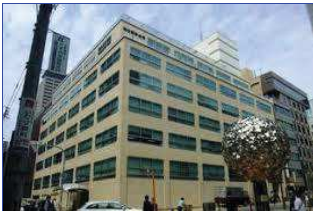
輸出繊維会館外観