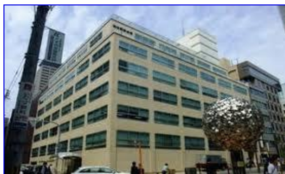
輸出繊維会館外観

TEL06-6484-6506 FAX06-6484-6575 E-Mail jtcc@nifty.com