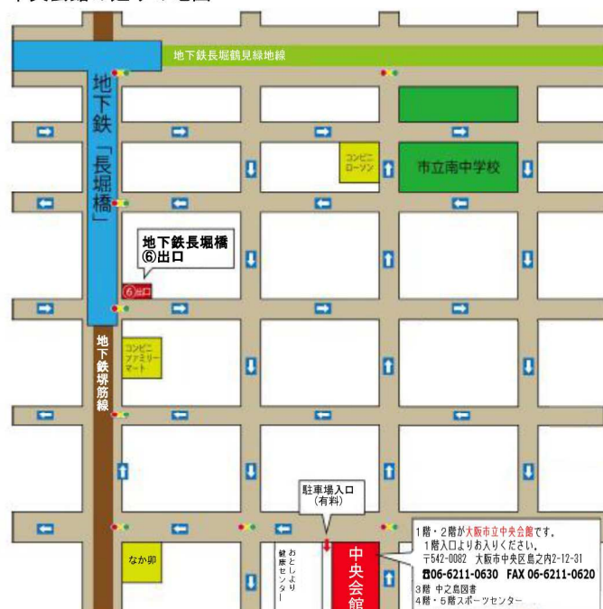
中央会館の廻りの地図